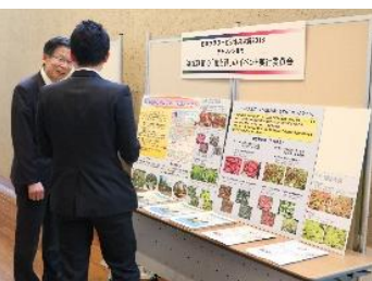
▲日本フラワービジネス大賞の展示