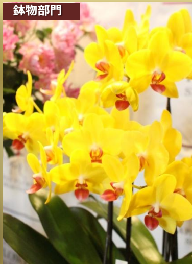
鉢物部門 (有)椎名洋ラン園 (千葉県) ファレノプシス ナオミゴールド 育成者: 椎名 正剛