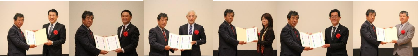
▲お忙しい中 今年も23社の受賞者のみなさまにご参加いただきました。どうもありがとうございました。

フラワー・オブ・ザ・イヤー受賞者のみなさまより育種・開発の想いを語っていただきました。