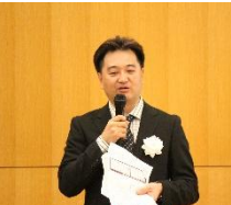
▼部門ごとに審査講評