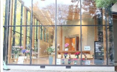
▲会場は東京大学農学部 弥生講堂一条ホール。